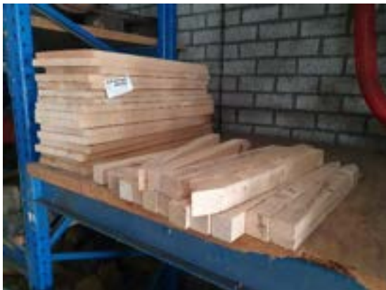
Ruw gezaagd Populierenhout

Zie hieronder het resultaat uit 2021-2022: