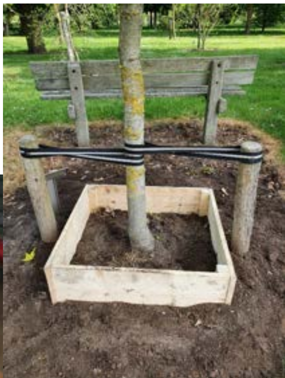
Testlocatie bomentuin d'n Hooidonk